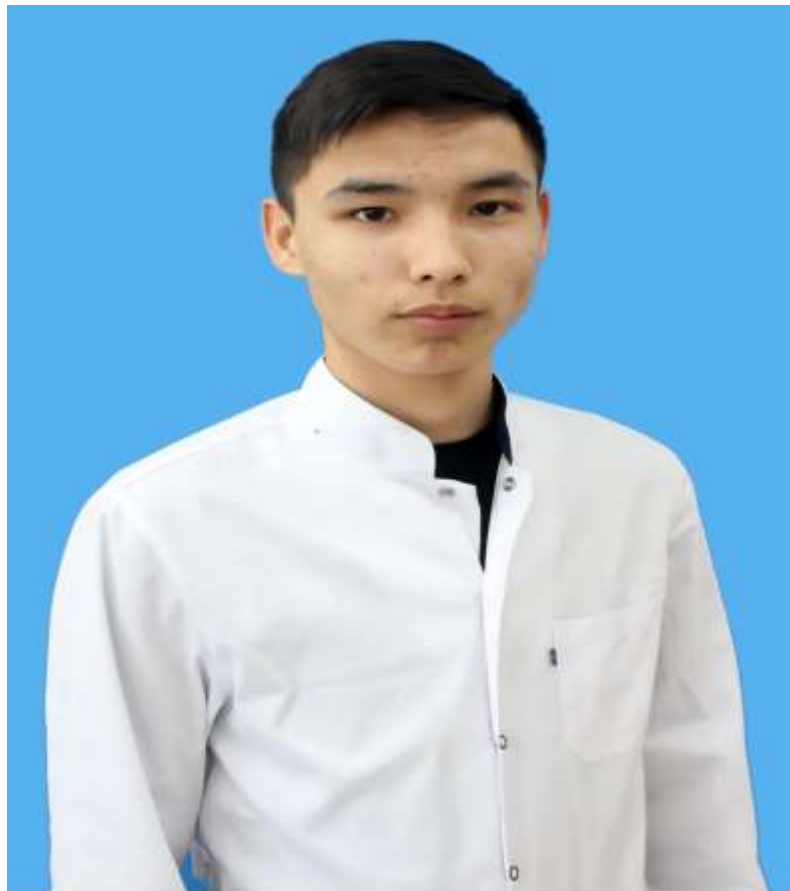
КазMSA ұйымының төрағасы Идиятулла Мұхамеджан